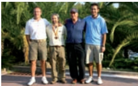
Campionat de Catalunya Matxplay 2009.