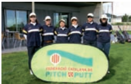
Selecció Catalana Femenina.