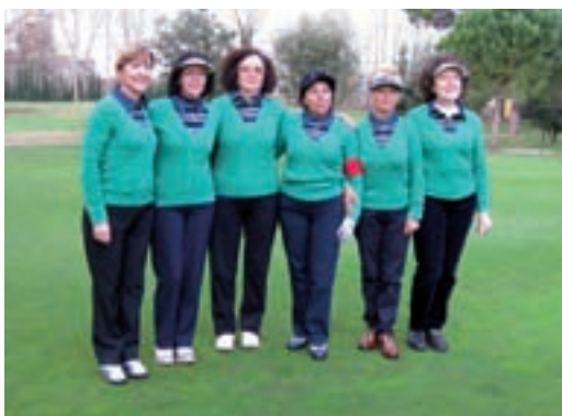
Vallromanes, equip guanyador handicap del 1r. Interclubs Femení ACPP.