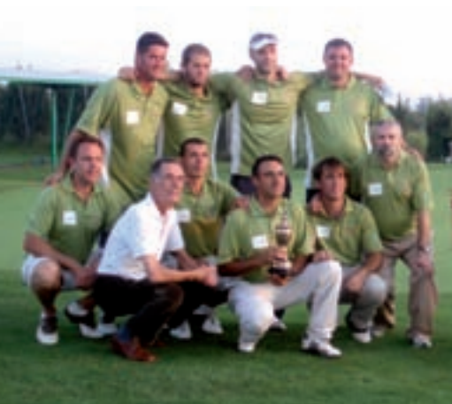
Badalona Motorsol Import, equip guanyador de la Copa Catalunya 2009.