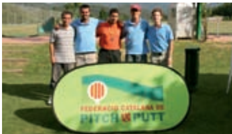
Campionat de Catalunya Absolut 2009.