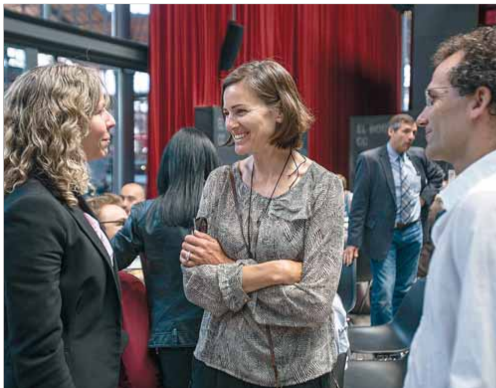
La regatista olímpica Via-Dufresne, al centre de la imatge

En Gerard Esteva ha presentat les credencials per ser ministre de l'esport de la república catalana. Veurem fins a quin punt el segueixen les federacions esportives en la seva visió, que per altra banda és engrescadora i sòlida.