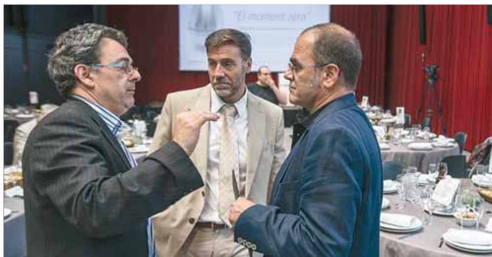
Espada, Sanz i Gispert parlen abans de començar el dinar