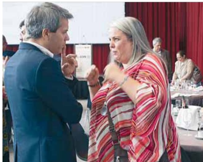
Domenjó i Fandos, ahir, a El Born Centre Cultural