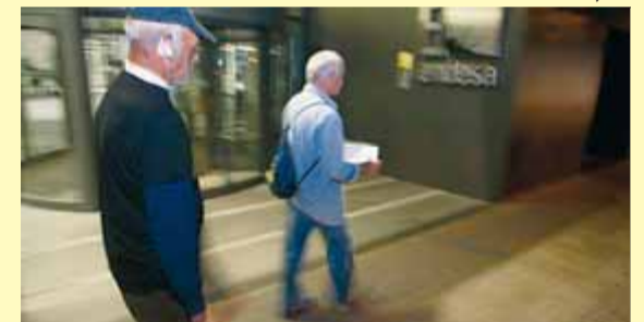
El recompte que es va fer dimarts a la nit ■ O. DURAN